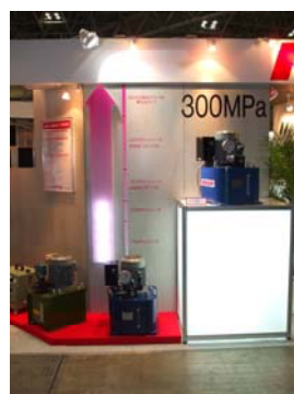
300MPa電動ポンプ (参考出展)